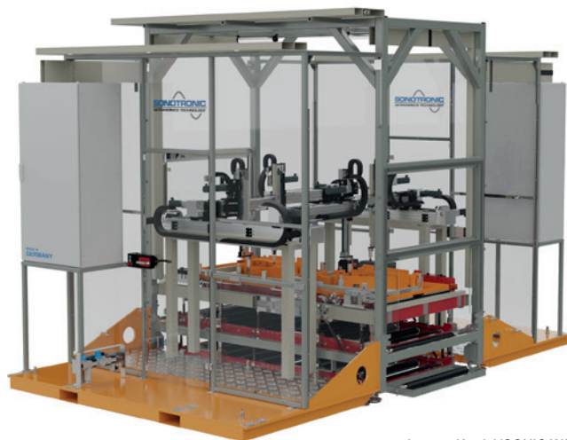
Integración del iSONIC WAVE XYZ en las líneas de producción